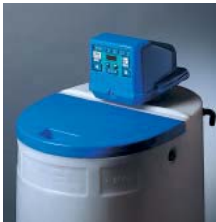
DECALUX VT 1000 AD monoblok