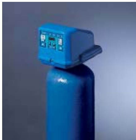
DECAL VT 1000 AD dvojité tělo