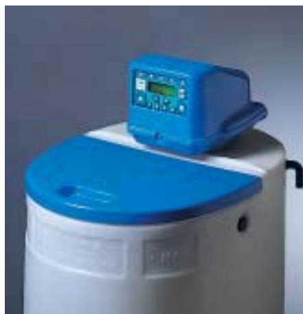
DECALUX VT 2000 AD monoblok

Časovač typu Timer VT 2000 BPA zajišťuje pomocí automatického směšovacího ventilu BY-PASS (patent GEL) stálou regulaci tvrdosti na výstupu.