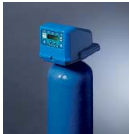
DECAL VT 2000 AD dvojité tělo